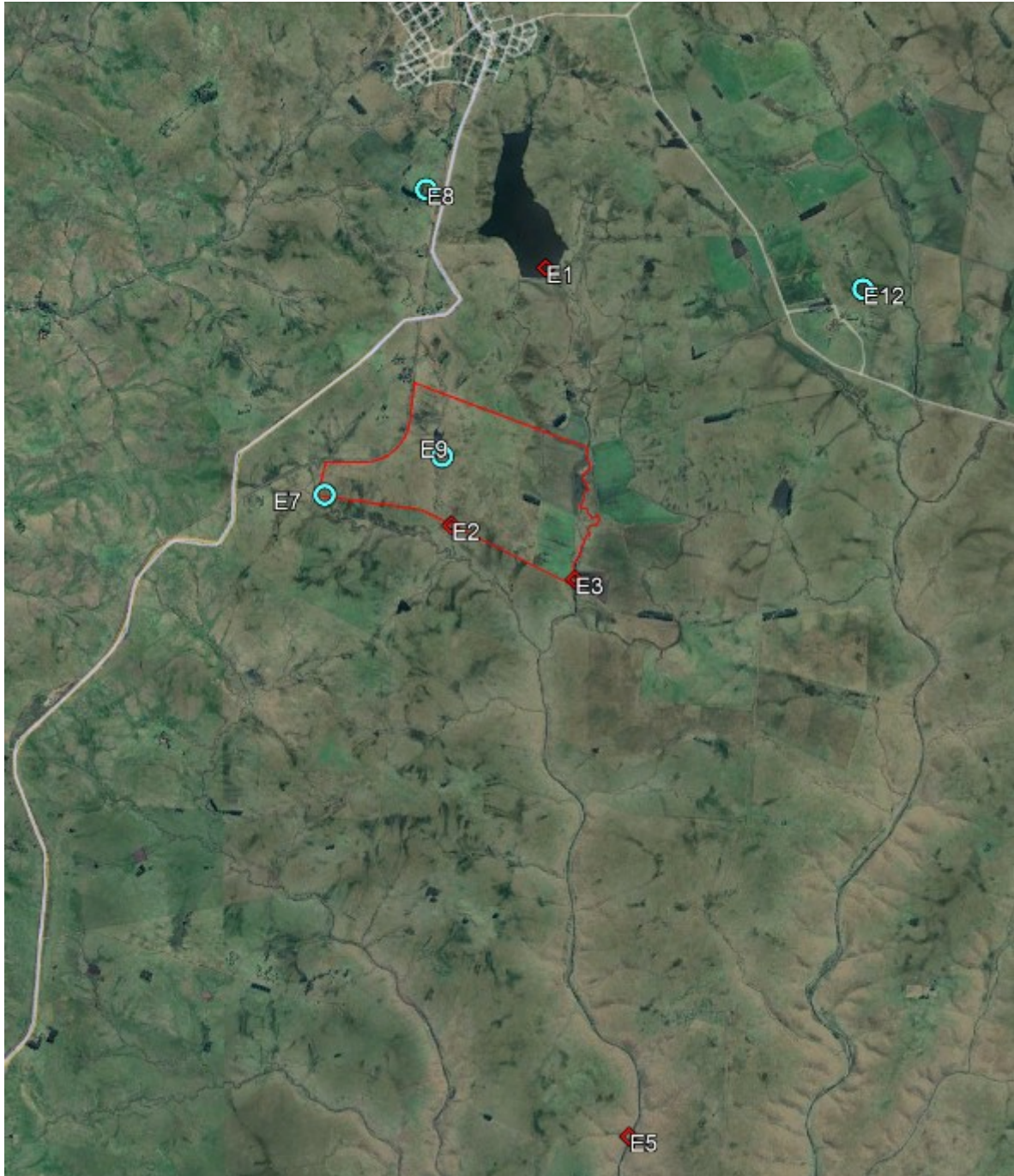
Figura 1: Área de estudio y ubicación de los puntos de monitoreo

La línea de base incluye monitoreo en ocho sitios, cuya ubicación se presenta a continuación: